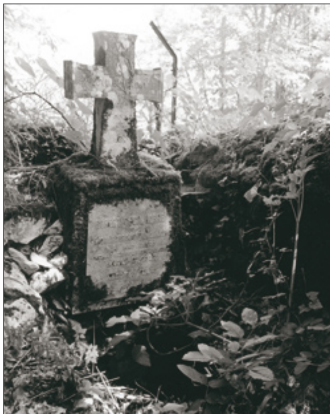
Tumba de Robert Cecil Horne en el cementerio civil de Covadonga.