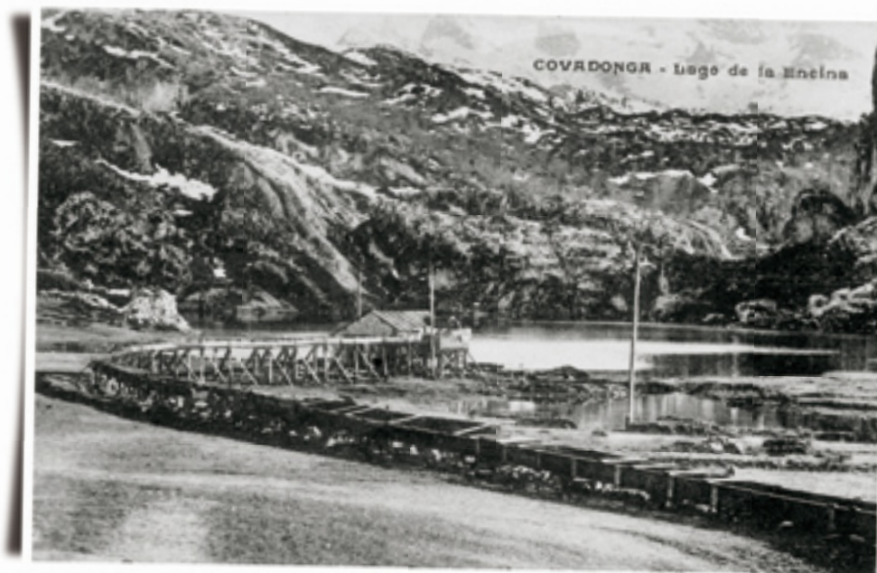
Estructura de captación y canalización del agua del lago de La Ercina. Utilizada para la producción de energía eléctrica y lavado de los minerales en las instalaciones de la compañía inglesa, The Asturiana Mines Limited, que explotaba el yacimiento de manganeso de Buferrera.