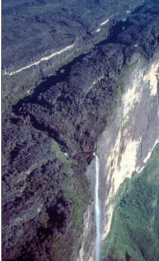
Salto Kukenán (840 m, la quinta más alta del mundo)