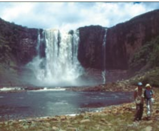
Salto de Chinak-Meru (105 metros de caída libre)

tial cercano al santuario antes de adentrarse en la Gran Sabana. En el Km 134 comienza la planicie de la Gran Sabana a una altitud de 1.420 metros.