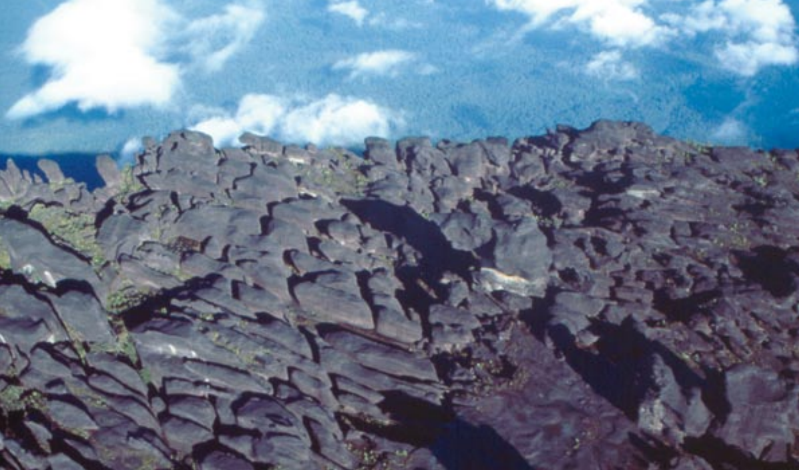
Superficie del tepuy Roraima

capital del Estado de Bolívar, el más grande de Venezuela. Desde la Ciudad de Simón Bolívar nos dirigimos hasta el campamento Chivatón, en medio de la Gran Sabana. Para alcanzar este campamento no queda más remedio que realizar una larga travesía por carretera aprovechando para visitar, en la ciudad de Puerto Ordaz, los parques de Chachamay y Lofling y ver sus saltos de agua de 20 metro de altura. Desde aquí cruzamos el río Caroní por dos puentes paralelos para llegar a la población de San Félix, en cuyos castillos se rodaron escenas de la película Papillón. Posteriormente hay que atravesar las poblaciones de Upata (fundada en 1762 por familias de las Islas Canarias), Guasipati ("tierra hermosa"), El Callao (famosa por sus minas de oro que atraían a aventureros y exploradores), Tumeremo, Las Claritas y el famosísimo San Isidro o "Kilómetro 88" (altitud: 180 m) verdadera frontera con la Gran Sabana. Desde aquí comenzamos a penetrar la Sierra de Lema con su bosque tropical y visitamos la Piedra de la Virgen (Km 98, alt. 480 m), formación rocosa de unos 80 metros de alto a cuyos pies se sitúa un santuario dedicado a la virgen de Lourdes y que constituye la entrada al Parque Nacional de Canaima, (establecido el 12 de junio de 1962 y considerado Patrimonio Mundial Natural por la UNESCO en 1994) posiblemente el parque más grande en el Mundo, con alrededor de 3.000.000 de hectáreas. Buen momento también para refrescarse en un manan-