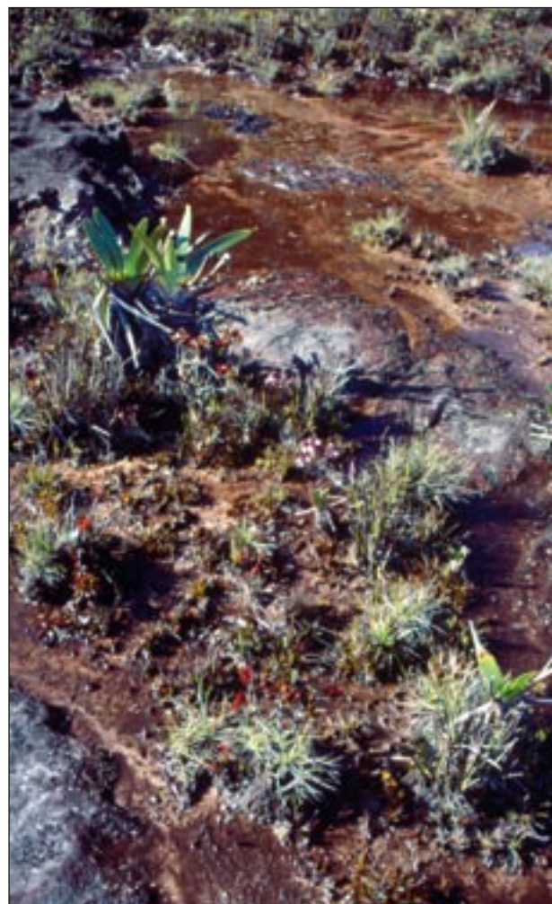
Flora del Kukenán

Para más información: javierdenoriega@telefonica.net