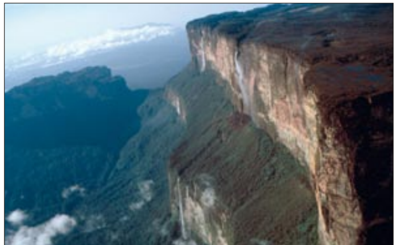
Salto de Chinak-Meru (105 metros de caída libre)

Pero, ¿qué significa Canaima?: “... los arekunas, como la mayor parte de las tribus precolombinas, no creen en la muerte natural; y para explicarse su eterna desaparición de este mundo, han creado un simbólico personaje, Canaima, que les persigue sin cesar y que a la postre los vence y mata. Es un polimorfo que toma nombre diferente según los sitios que habite; bajo las aguas, en la cúspide de los montes o en lo profundo de las cañadas; su ubicuidad es portentosa; no hay refugio ni lugar agreste y