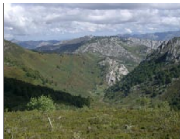
Xulió desde la collada L'Arau

El descenso lo iniciaremos desde la cima hacia el norte buscando un sendero que por la ladera va descendiendo hacia el Cantu la Mostayera para llegar a la Mayada Les Llanes donde hay una fuente. El sendero ahora por mejor terreno y bien marcado, continúa bajando hasta la mayada de Pandanes.