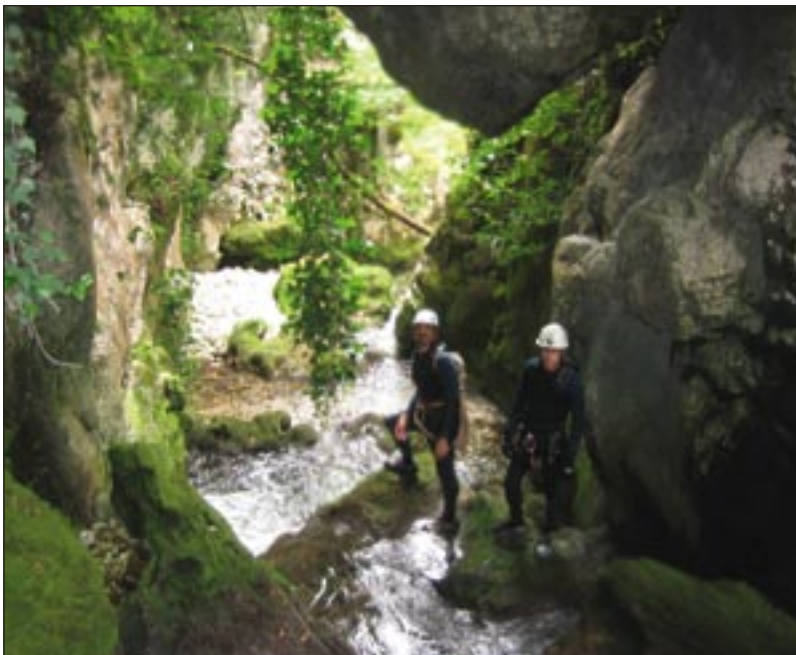
Aproximación al barranco de Rubó

Francia, por parte de Edouard Martel fundador de la Asociación Espeleológica Francesa y considerado fundador de la espeleología moderna. En España una de las primeras apertura de las que se tiene noticia es la de la garganta de Escuin en Pirineos en 1903, época en la que proliferan las exploraciones tanto en el Pirineo como en la Sierra de Guara, siendo esta hoy una de la más rerepresentativas en el barranquismo español. Los más afamados aventureros de la época se vieron atraídos por esta nueva actividad, hay constancia de la presencia de un viejo conocido de Picos de Europa como es el conde de Saind-Saud en la exploración del Mascún. En los años 50 casi todos los itinerarios estaban descubiertos, pero no fue hasta los años 70 y 80 cuando esta actividad vivió el boom que le ha llevado a la actual situación de popularidad.