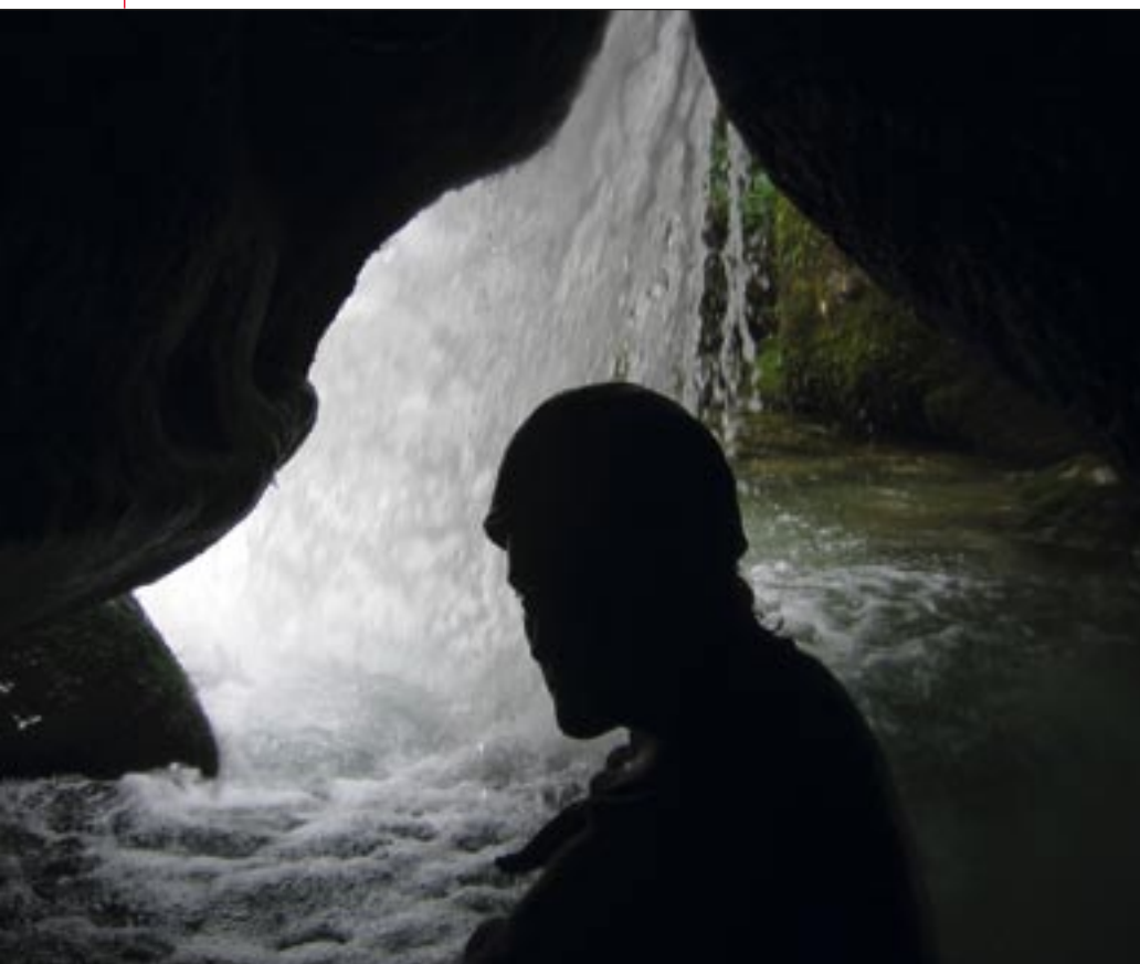
Destrepa de la cascada de Rubó

tres primeros de 10m el cuarto de 11m y el quinto de 8m aunque este tiene un destrepe muy interesante, un pequeño orificio a la izquierda nos introduce en una mini cueva que tiene su salida justo debajo del chorro de la cascada. Todos los rápeles están muy bien equipados fruto de una reciente reequipación con parabol inoxidable. El tobogán tiene un puente de roca generalmente instalado un una pequeña cuerda que nos ayudará a escurrirnos los primeros metros muy verticales. Desde aquí solo nos queda disfrutar de poza en poza con pequeños toboganes y saltos, un auténtico acua-park en plena naturaleza. Antes de salirnos del barranco tenemos el último salto este ya un poco más grande, los más atrevidos aun tienen en el camino de retorno el puente romano de la Vidre con un salto que ronda los 10m.