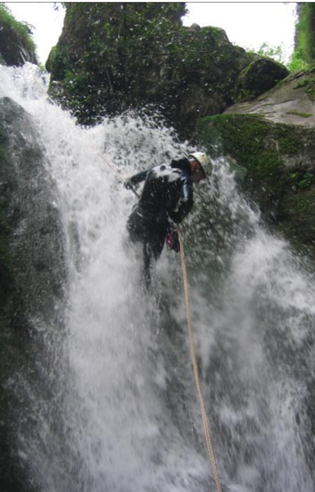
Cascada de Rubó

El Barranquismo es uno de los deportes de montaña o deportes de aventura, son muchas las definiciones que en la actualidad reciben estas prácticas deportivas al aire libre, que más auge ha tenido en los últimos tiempos. En la actualidad son muchos los clubes de Montaña y federaciones que han incluido en sus secciones y programaciones el Descenso de Barrancos. Incluso la Administración Pública, ante el gran incremento de empresas y clientes que demandan estos servicios, se ha visto obligada a dar los primeros pasos cara a la regular la actividad de empresas, guías y materiales.