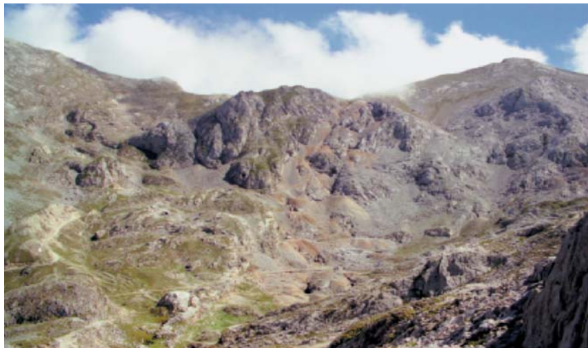
Ándara: explotaciones mineras de La Providencia en la Cuesta de La Escalera (vertiente noroeste del collado San Carlos).

Para poder dar salida al material fue preciso construir caminos que enlazasen Áliva con Espinama