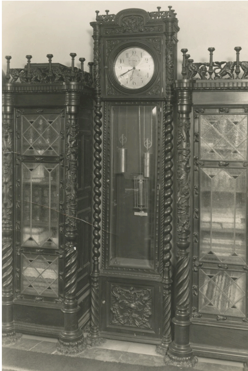
Reloj del Sultán Muley Abd El Hafid