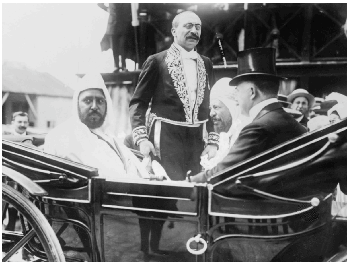
El Sultán Muley Abd El Hafid en Marsella 3